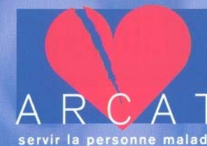
Illustration : Xavier Etchepare Edition décembre 2002